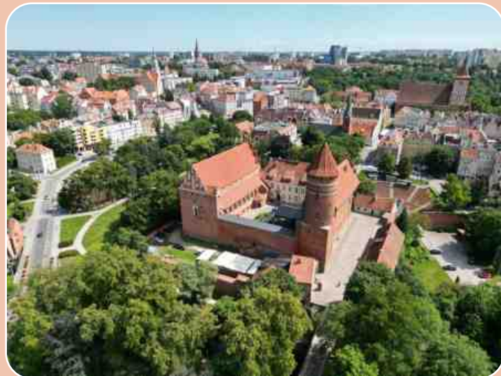
(Schloss Olsztyn)

Am Abend erwartet Sie im Hotel ein Folkloreabend mit masurischen Spezialitäten, Musik, Tanz und natürlich dem Nationalgetränk Wodka.